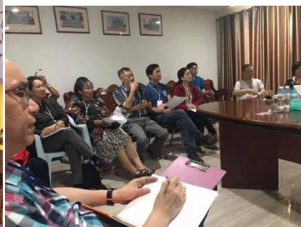
門徒訓練中心第一屆畢業典禮暨宣教異象分享研討會 (2019年11月5日至8日)