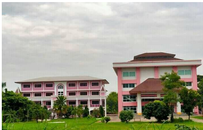
天恩職業學校(即將開始)