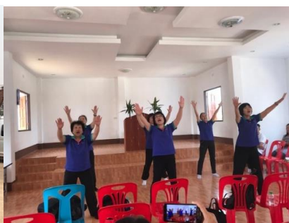
讚美操團隊 - 2019年4月 2020年8月通訊